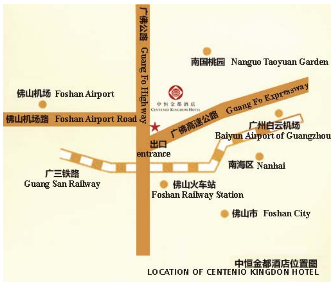
大沥中恒金都酒店位置图